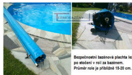
Bezpečnostní bazénová plachta leží po stočení v roli za bazénem. Průměr role je přibližně 15-20 cm.

Vždy je zapotřebí si promyslet na kterou stranu se plachta bude stáčet. Doporučujeme plachtu stáčet směrem od schodiště, žebříku apod., aby ve stočeném stavu nestála v cestě vstupu do bazénu.