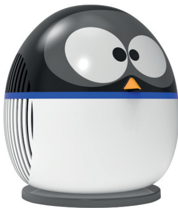
Tučňák / Penguin – 565NRP008