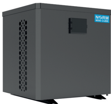
Norm Mini Cube – 565NRC008