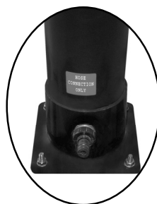
vypouštěcí a napouštěcí zátka