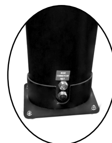
vypouštěcí a napouštěcí zátka