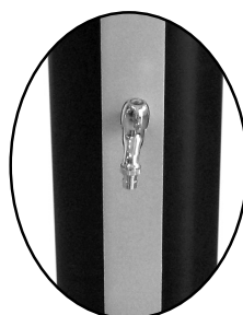
kohout na omývání nohou