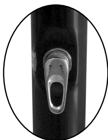
směšovací páková baterie