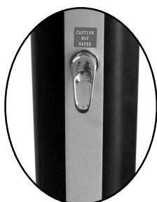
směšovací páková baterie